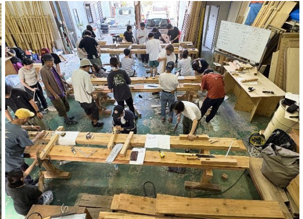
dot architects + adanda 「アーキジム」(実施風景) 2025 年