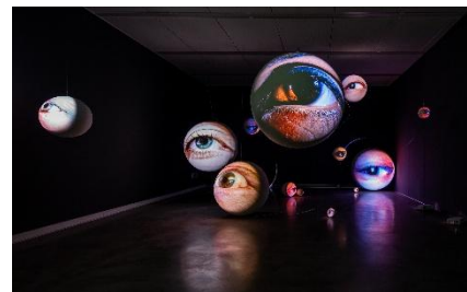
Tony Oursler. Open Obscura , 1996/2013. Installation view of Tony Oursler: Black Box , Kaohsiung Museum of Fine Arts, Kaohsiung, Taiwan, January 23–May 16, 2021.