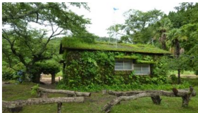
木村崇人《森ラジオ ステーション》 2014年