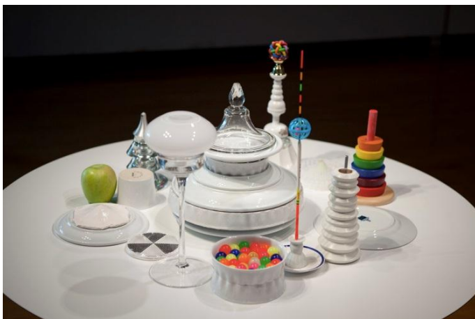
《Savage structures / 野生のストラクチャ》 2013年 鑄込み磁器、既製のセラミック、ガラス、プラスチック、ゴム、金属、木製品、種子、果実など