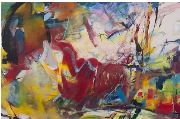
《View-trees on the uphill, Nov. 2012-Jan. 2013》2013年 顔料・アクリル・その他、キャンバス 218.2×333.3cm 個人蔵

主な個展に2002 佐藤美術館（東京）、2005年「大原美術館 ARKO 津上みゆき」（大原美術館、岡山）、2008年「24seasons-つづるけしき、こころつづく」（スパイラルガーデン、東京）、「a public place-風景の欠片（かけら）」（ギャラリー・ハシモト、東京）、2013年「津上みゆき展 View—まなざしの軌跡、生まれる風景」（一宮市三岸節子記念美術館、愛知）など。