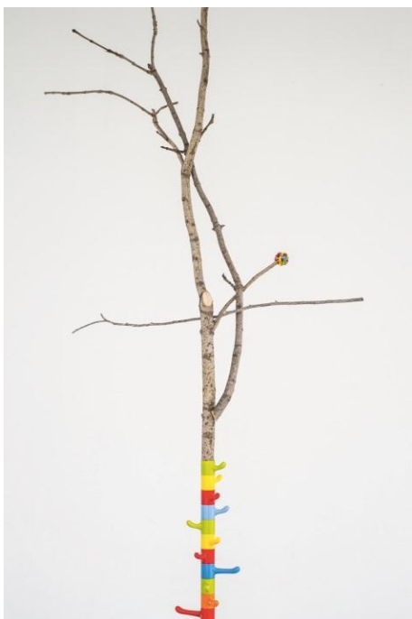
《Savage structures / 野生のストラクチャ》2013年 既成の金属、ゴム製品、枝

現在まで、植物の種子を展示空間に蒔き成長を見守るインスタレーションや、鳥や果実といった自然物と園芸用品や鳥よけなどの既製品を組み合わせたインスタレーションなど、多様な素材を組み合わせ作品制作に取り組んでいる。